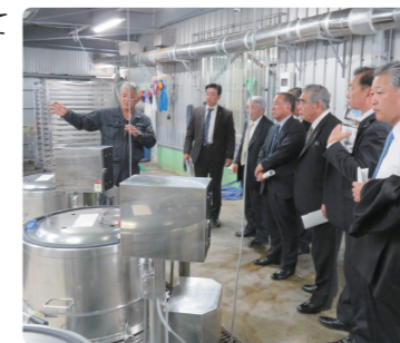
▲与那国薬草園(株)(11月27日)